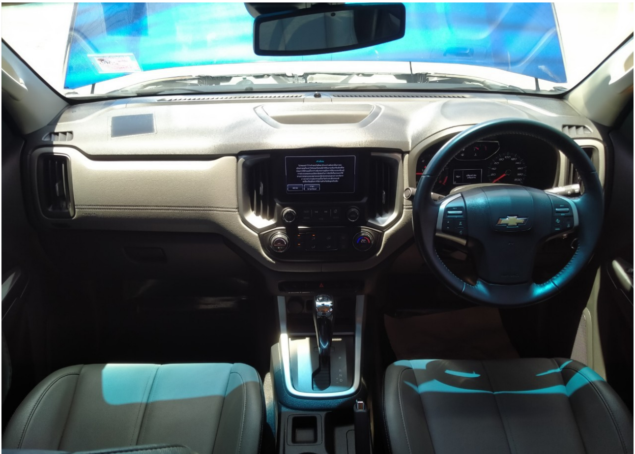
ภาพภายใน

รถสภาพดี โครงสร้างไม่เคยมีอุบัติเหตุ ไม่เคยจมน้ำและไฟไหม้