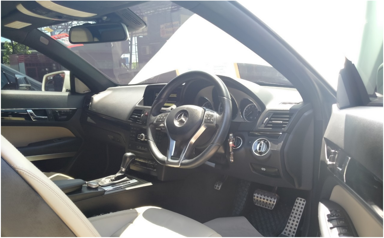
ภาพภายใน